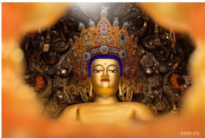
Статуя Джово Шакьямуни

Духовный центр Тибета и священное место для всех последователей тибетского буддизма. В центральном зале находится главное сокровище монастыря – статуя Джово Шакьямуни, которая была изготовлена еще при жизни Будды.